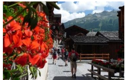
Zicht op Hôtel Les Diablons